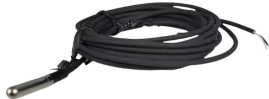
NTC Probe Inox

Os sensores de imersão AERIS são robustos e atendem os mais diversos ranges de temperatura e encapsulamentos.