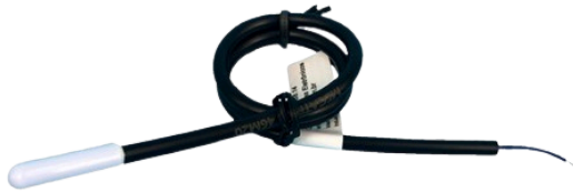
NTC Probe ABS